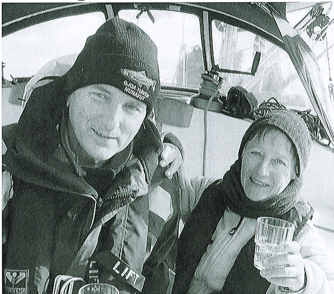
Les deux intrépides voyageurs lèvent un verre à la réussite de leur aventure, à l'entrée du détroit de Béring.