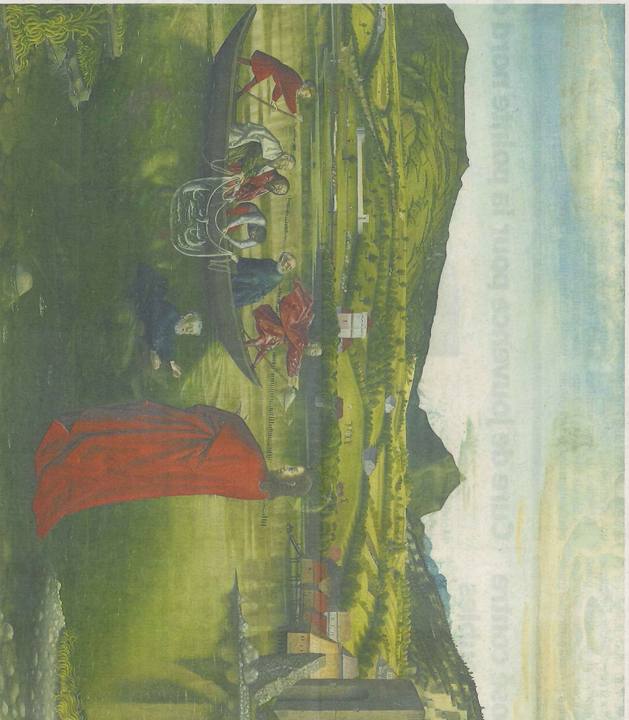
«La pêche miraculeuse» est le plus connu des deux panneaux double face du retable, conçu pour la cathédrale Saint-Pierre.

« Konrad Witz et Genève », du vendredi novembre au 23 février au Musée d'art et d'histoire, rue Charles-Galland 2, du ma au dimanche 11 h à 18 h. www.ville-ge.ch/mah