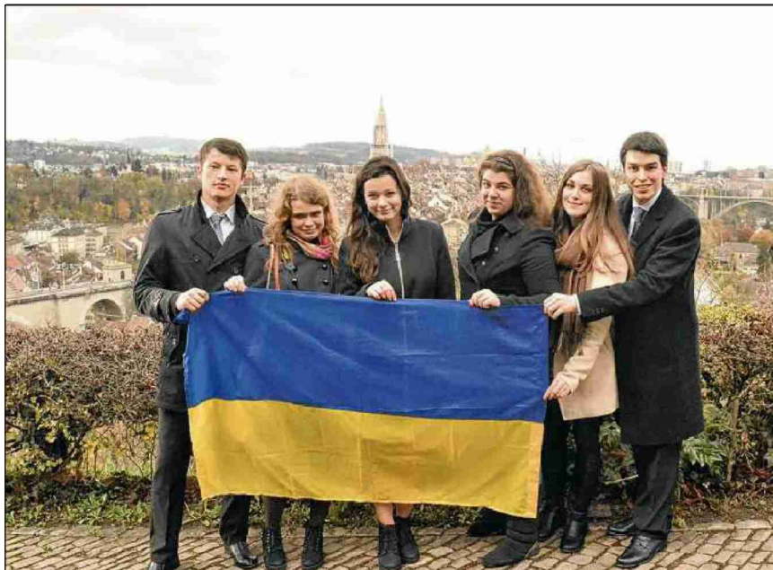
Des étudiants ukrainiens de passage à Berne sont fiers d'un drapeau national qu'ils veulent porter haut, en s'engageant dans la réforme des structures étatiques. DR

Non, mais nous avons mis en place une école pour conseiller celles et ceux qui veulent se porter candidats aux élections régionales qui se tiendront à l'automne 2015 dans les conseils des villes et des régions. D'ici quelques années, ces jeunes iront aux élections au Parlement pour proposer des plans d'action et y être une masse critique. Peut-être pas la majorité, mais la majorité idéologique, programmatique et morale. |