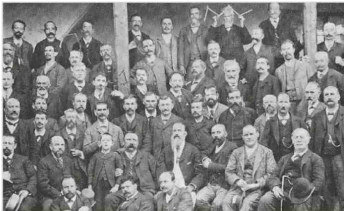
LA CHAMBRE SYNDICALE EN DEPLACEMENT À VEYRIER EN 1891

>> Le GGmb fêtait en 2015 ses 125 ans d'existence. Cette association patronale, l'une des plus anciennes du canton, œuvre pour la défense des intérêts de ses affiliés regroupant des entreprises actives dans les domaines de la charpenterie, de la menuiserie et de l'ébénisterie. Outre une soirée de commémoration réservée aux membres, la publication d'un ouvrage qui retrace l'histoire des métiers du bois à Genève, du Moyen Âge à nos jours, constitue le point d'orgue incontestable de cet anniversaire.