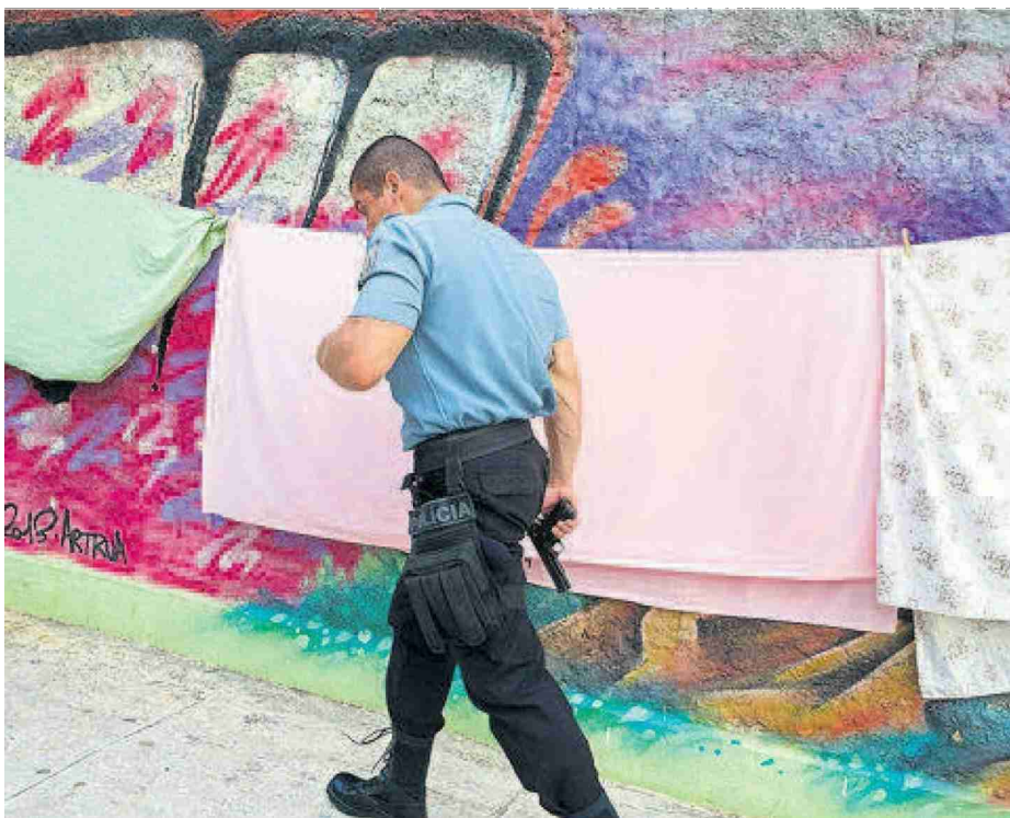
Dans «Changing Rio», Michael Graffenried capte la sensualité du quotidien, sauvage et civilisé dans le même temps.