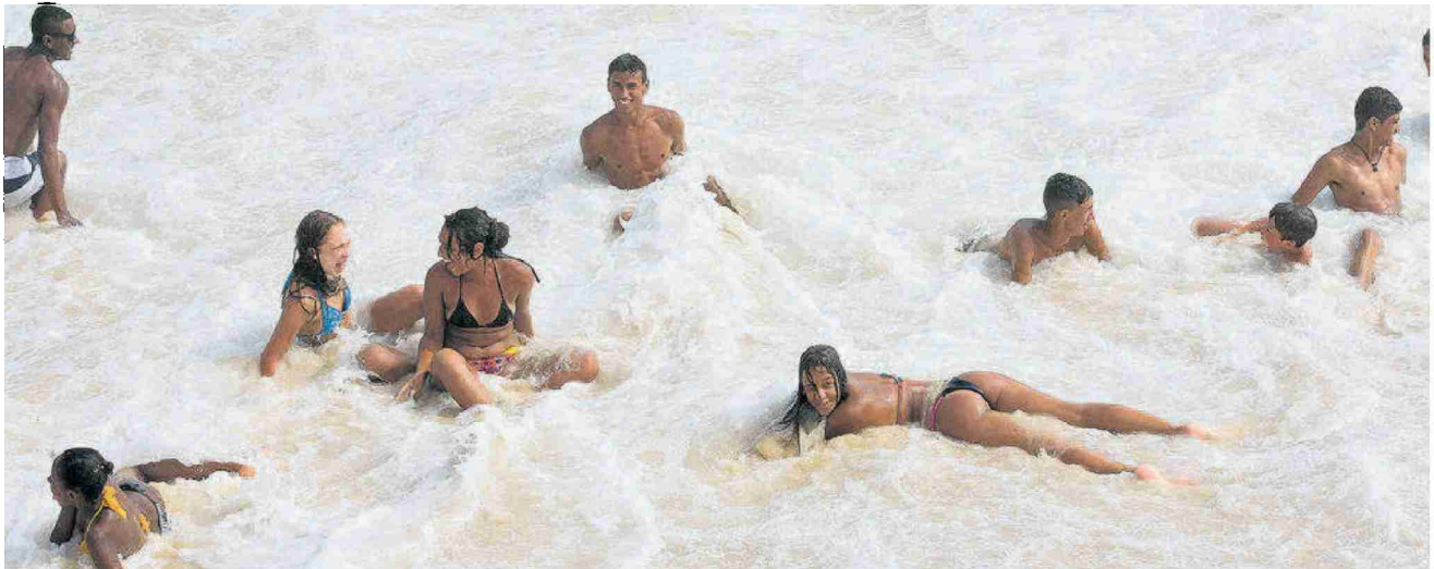
Au-delà du cliché du culte du corps sur les plages se marquent aussi les effets pervers de l'occidentalisation, la menace de l'obésité dans la classe moyenne par exemple.

N° de thème: 844.003 N° d'abonnement: 844003 Page: 20 Surface: 193'433 mm 2