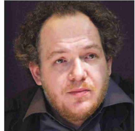
Boualem Sansal, Sorj Chalandon et Mathias Enard: trois auteurs incontournables de cet automne littéraire.

Un peu moins de 600 romans publiés par des éditeurs français sont attendus en librairie ces prochaines semaines. Présentation de quelques incontournables de la rentrée littéraire.