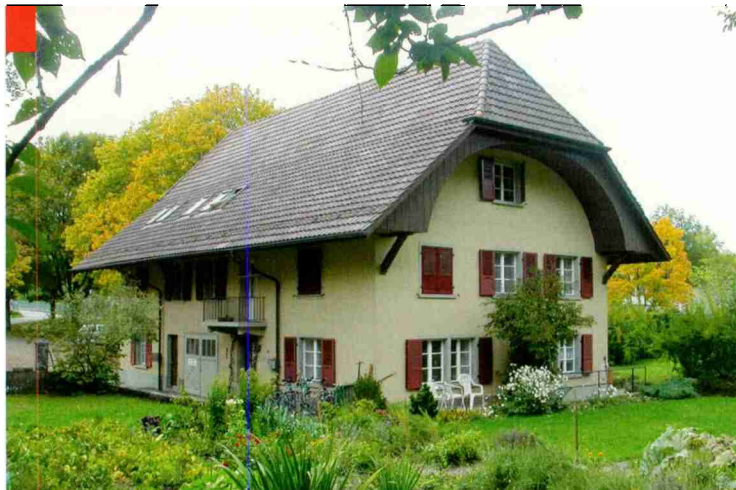
Le PC de la P-26 à Oberburg, près de Berthoud.