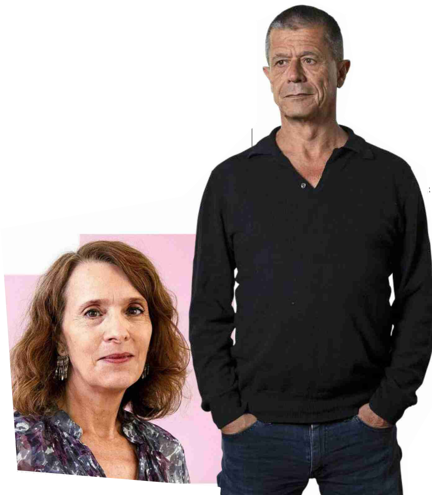
Emmanuel Carrère.