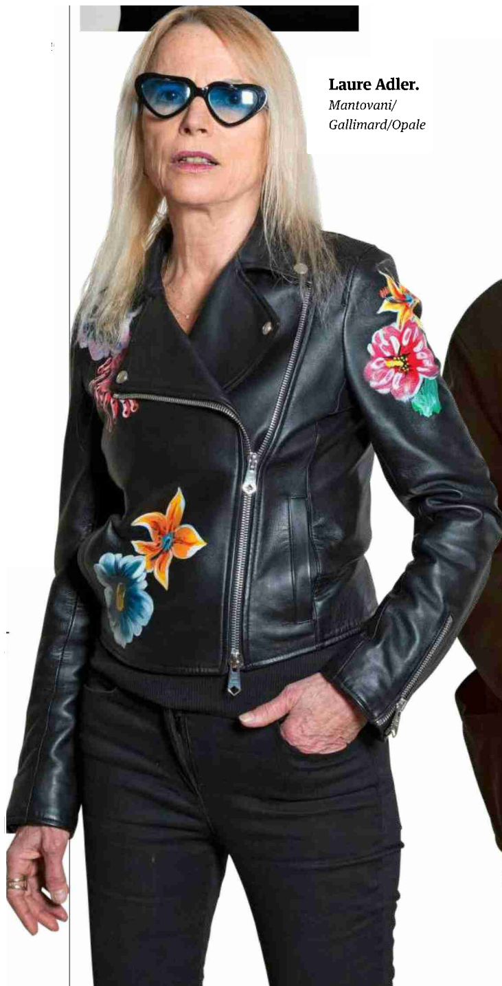
Laure Adler.