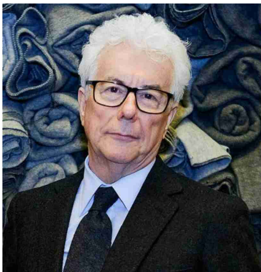
Ken Follett.