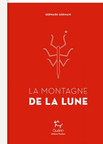
La Montagne de la Lune Bernard Germain Ed. Paulsen/Guérin, Chamonix, 2022

géologue...), il nous conduit progressivement dans ce monde originel des Pygmées, depuis les volcans Virunga jusqu'aux glaciers du Pic Stanley. Mais son récit ne lève pas tous les voiles de brume. Nous sommes envoûtés par cette histoire de Pierrine et Simon à la recherche d'eux-mêmes et d'un ailleurs, où s'entremêle l'aventure solitaire de Pierre, guide célèbre, et père de Pierrine. On est avide de connaître les sources de cette histoire, comme les explorateurs qui vont là-bas rechercher les sources du Nil et se frotter aux savoirs ancestraux des peuples premiers. Ce qu'il nous reste en fermant ces pages, c'est la douce sensation d'avoir flotté dans un pays merveilleux fait d'une nature sauvage, où le