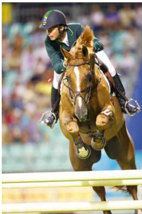
Rodrigo Pessoa et Baloubet du Rouet , gagnants en 2004 après une première manche à 8 pts, un barrage frustrant et une 2 e place qui se transforma en or deux ans plus tard. Le lucky dollar avait-il encore frappé ?

« Bill Steinkraus avait monté avec un lucky dollar en 1968, et vingt ans plus tard, en 1988 à Séoul, il l'a donné à Pierre (Durand) parce qu'il aimait beaucoup Jappeloup . Pierre l'avait gardé et, en fouillant dans un tiroir avant de partir à Athènes, il m'avait dit « Je vais prendre le lucky dollar et on verra bien ». J'avais fini de faire ma reconnaissance, j'étais assis le long de la piste – j'aime bien m'asseoir 5 minutes sur le numéro d'un obstacle, sur la piste, quand j'ai fini la reconnaissance –, je m'en rappelle comme si c'était hier, j'avais les jambes croisées et Pierre vient vers moi. J'allais partir, donc je me lève et là il prend le billet et me le met dans la poche, en me disant : « Tiens, monte avec ça, ça va te porter bonheur ! » Je ne me suis pas posé de question, j'ai fermé mon zip et je suis parti. Puis j'ai fait une première manche catastrophique, avec deux fautes. Je suis presque parti, j'étais tellement furieux. C'était l'occasion de prendre ma revanche sur Sydney. La pause était très longue, je pensais renoncer à la seconde manche, j'ai même essayé de téléphoner pour trouver un vol Athènes-Bruxelles, mais impossible de trouver un avion. Heureusement ! »