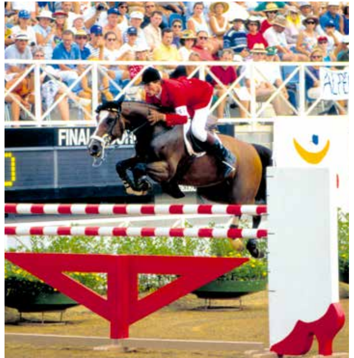
Ludger Beerbaum. Le héros des JO de Barcelone 1992 avec Classic Touch , est le cavalier le plus titré de tous les temps, mais cela n'empêche pas le Kaiser de désigner Steve Guerdat comme « le Federer du saut d'obstacles .» Un bien beau compliment, non?

« Jappeloup voyageait bien en avion. Toutefois, pour l'anecdote, pour être totalement tranquille, j'avais demandé à un très bon ami pilote à Air France d'être aux manettes du 747 qui convoyait nos chevaux... »